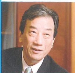
黒川 清 (くろがわ きよし)